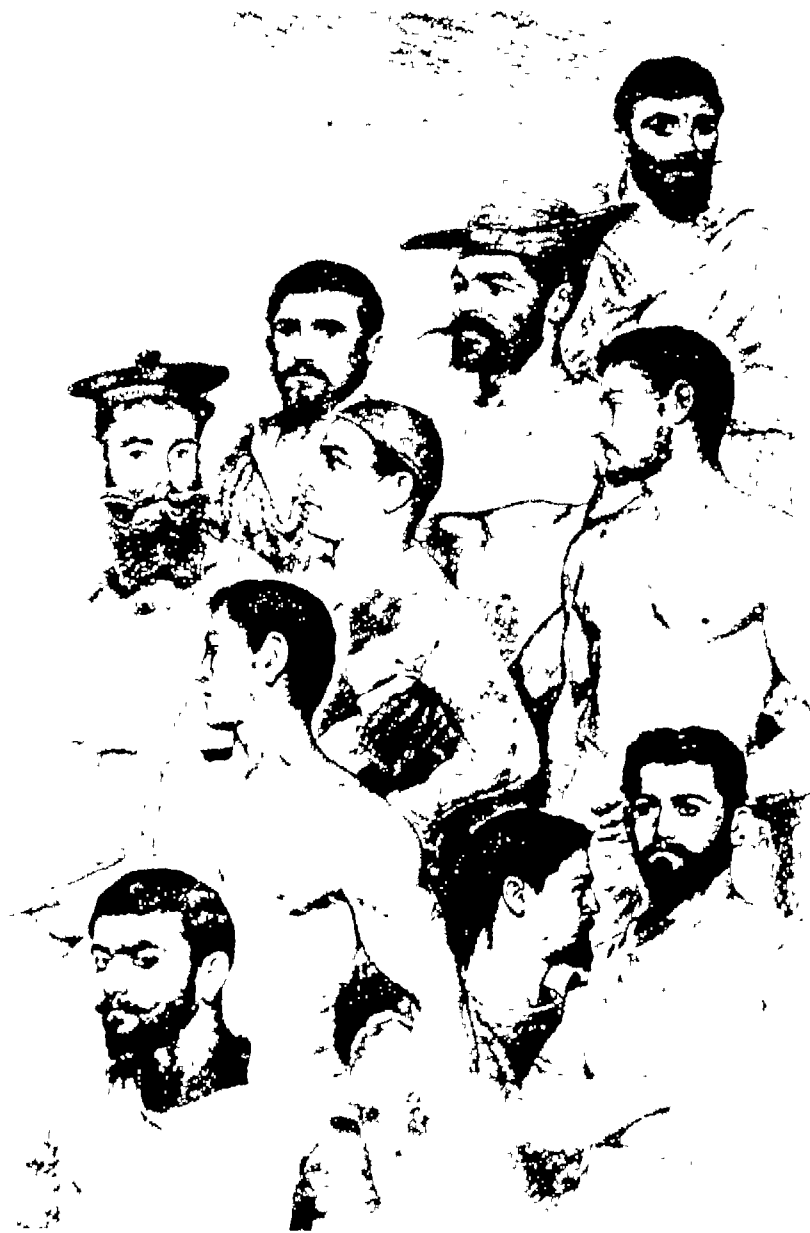
برشة نجر الموق، بعض زملاء العمال على الساحة بربوشتات.